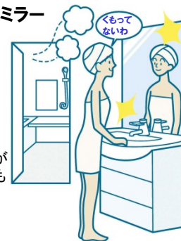
※3面鏡はセンターミラーのみ、2面鏡はメインミラーのみ。

電気代ゼロで、全面クリア。 新感覚のミラーです。 鏡の表面に、吸水性・親水性の ある膜をコーティング。 狭い部分しか効果のなかった 従来品(ヒーター)に対し、全面が くもりにくいので、お風呂上がりも 鏡はいつもクリア。電気代も かからないので経済的です。