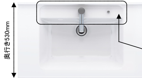
(画像は幅900mm) ●ボール深さ:165mm 容量:12L