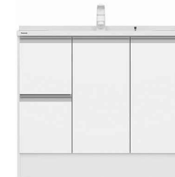
引出しタイプ (画像は幅900サイズ)