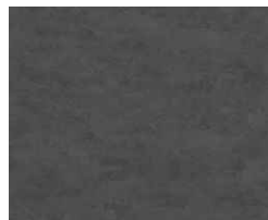
ヴィンテージメタル柄