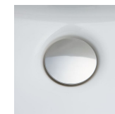
掃除しにくいフチの 隙間がない排水口。