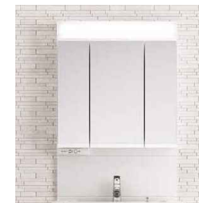
長寿命で経済的なLED。蛍光灯に 比べて電気代も節約できます。