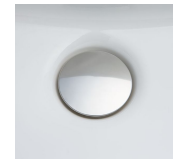
掃除しにくいフチの 隙間がない排水口。