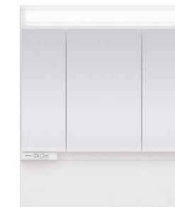
スタンダードLED3面鏡 ミドルパネル