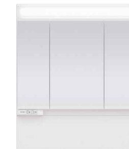
スタンダードLED3面鏡 ミドルパネル