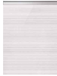
アルベロホワイト(鏡面)