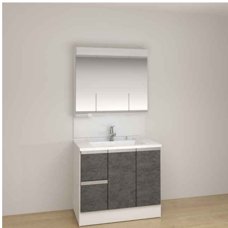
※画像はイメージです。組合せなどはお見積書をご確認ください。