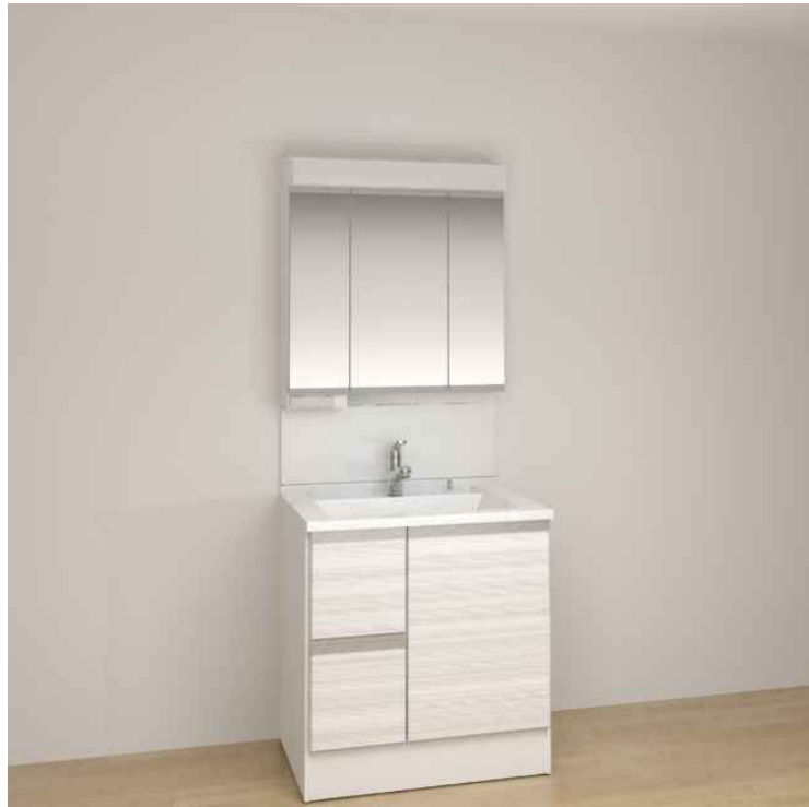
※画像はイメージです。組合せなどはお見積書をご確認ください。