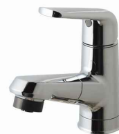
マルチシングルレバーシャワー (メタルタイプ)(エコカチットあり) ※シャワーヘッドは引き出せます。