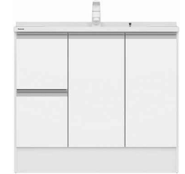
引出しタイプ (画像は幅900サイズ)