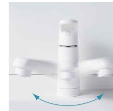
吐水部を左右に首振りできま す。(画像はスコピカタイプ)