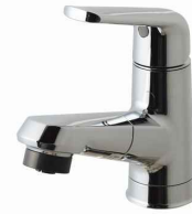
マルチシングルレバーシャワー (メタルタイプ)(エコカチットあり) ※シャワーヘッドは引き出せます。