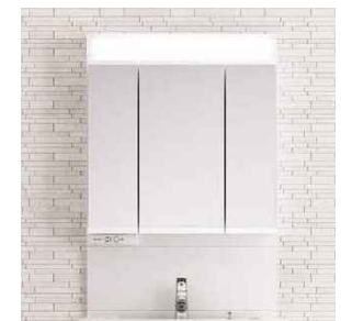
長寿命で経済的なLED。蛍光灯に 比べて電気代も節約できます。