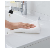
水に濡れた物を置くのに便利な ウェットエリア。継ぎ目や隙間がなく、 汚れてもささっと拭くだけ。